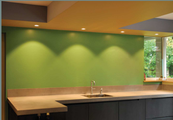
↳ Innenansichten mit finaler Farbgestaltung: Flur Erdgeschoss, Flur Obergeschoss, Küche