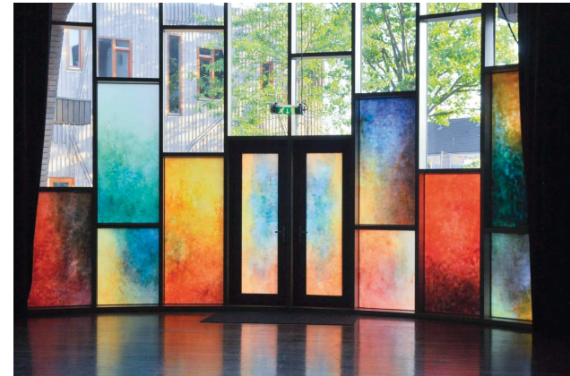
↳ Ohne Titel, Ölmalerei auf Leinwand, 2016